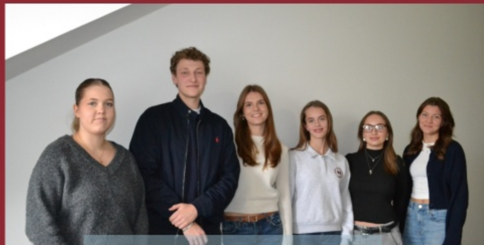
SMV SJ 25/26